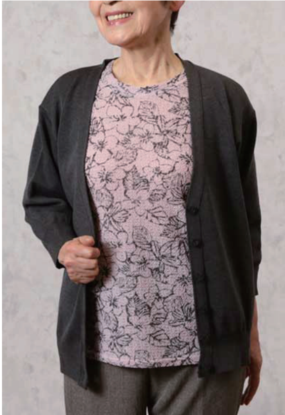
モデル身長 152cm M 着用