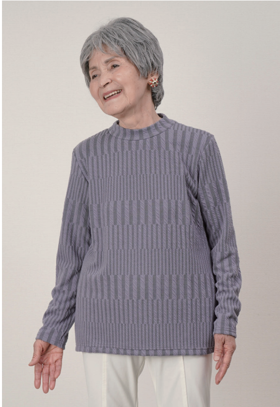
モデル身長 152cm M-L 着用