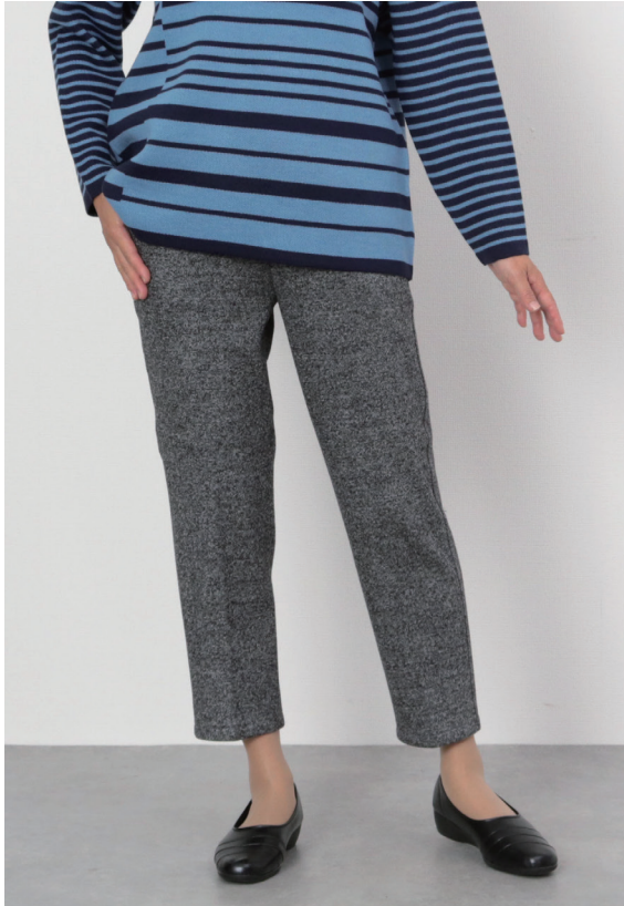
モデル身長 159cm M着用